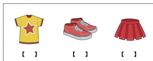
圖1：成長級一聽對話選圖

為了讓小朋友快樂地學習華語，便設計深受小朋友歡迎的連連看題型，以聽句子連連看為例，考生只要理解聽到的句子，就可以將小圖連到大圖中正