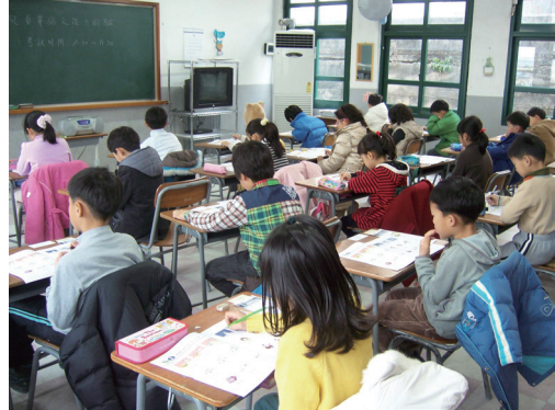
圖5 韓國地區考試現場

舉辦過兒測的老師們覺得試題相活潑、有趣，很願意向學生和家長推薦這套測驗，更有老師反應這套測驗啟發他們重新思考自己如何在教學及評量上更進一步，以及提醒他們激發學生學習的熱忱，達到最好的成效。參加兒測的考生表示：試題是日常生活及課堂教學中所學的內容，使他們不害怕這項測驗，也想多了解自己的華語程度，讓自己對學習華語更具信心。圖4、5是多明尼加及韓國地區考生參加兒測的照片。