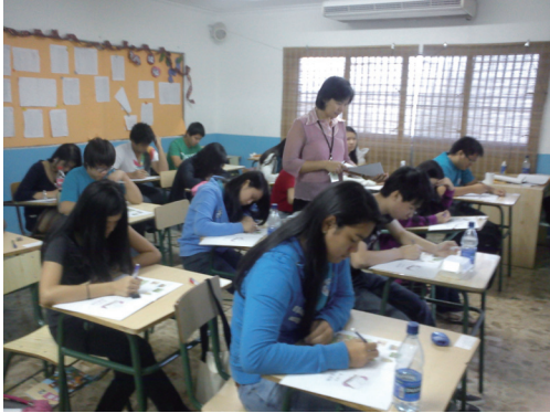
圖4 多明尼加地區考試現場